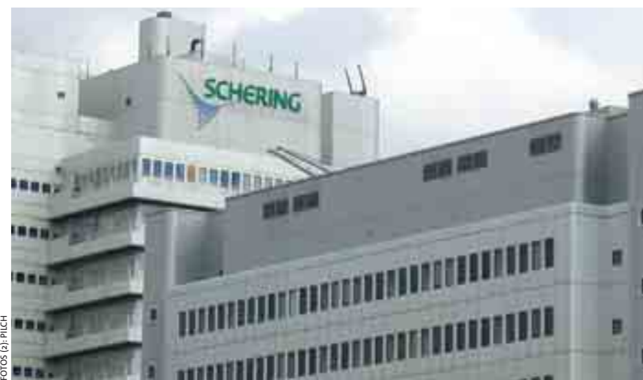
Berlin wird Sitz des neuen Gemeinschaftsunternehmens sein.

In der hiesigen Pharma-industrie verschieben sich die Gewichte: Aus Bayer und Schering wird die »Bayer Schering Pharma AG«, mit neun Milliarden Euro Umsatz die neue Nummer eins in Deutschland und nach Einschätzung der IG BCE auch mit größeren Chancen auf dem Weltmarkt.